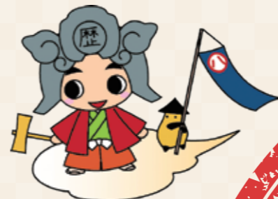
歴まちくんとおとも