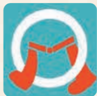
アプリのアイコン