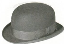
お気に入りのとっくりと山高帽