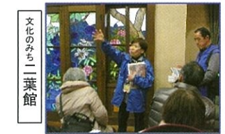
文化のみち二葉館