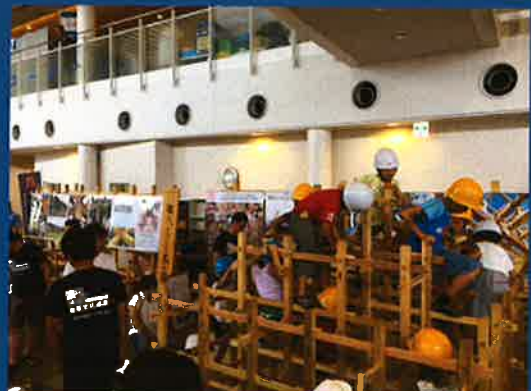
【子供達による木構造ジャングルジム製作体験】