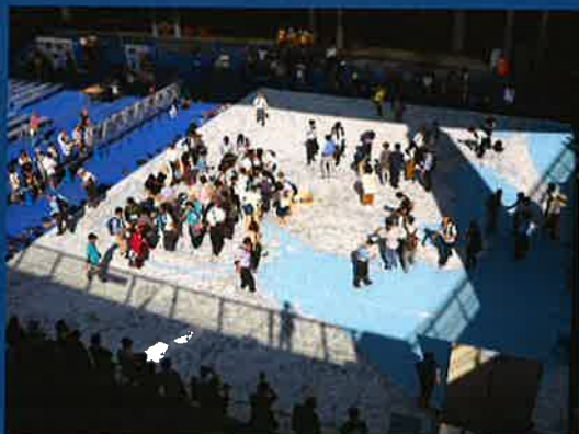
【プロジェクションマッピング学習】