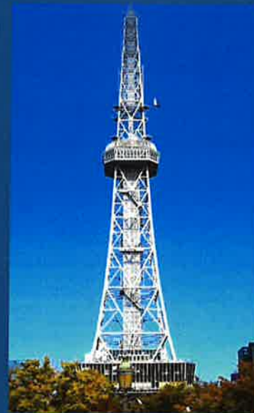
【名古屋テレビ塔免震改修工事 見学ツアー】