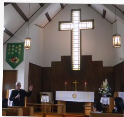
内容② 教会についてのお話