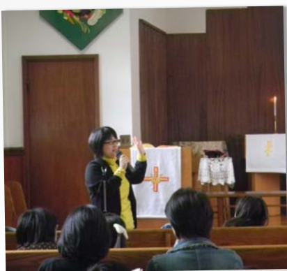
内容① 建物の説明&見学

主催：愛知県国登録有形文化財建造物所有者の会（略称：愛知登文会） 助成：文化庁「文化遺産を活かした地域活性化事業」 後援：名古屋市教育委員会 実施協力：宗教法人日本福音ルーテル復活教会、なごや歴まちびとの会 実施担当：株式会社 都市研究所スペースア