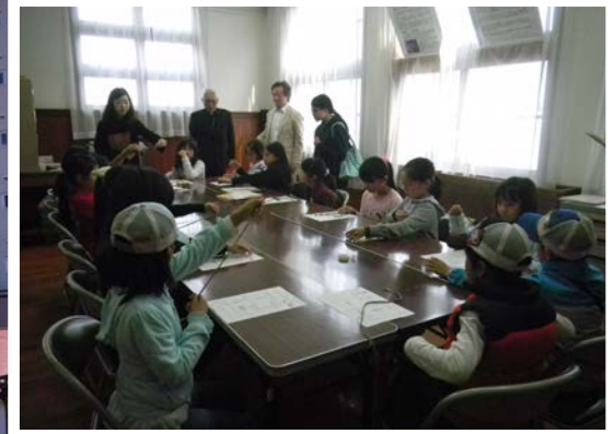
▲ ミサンガ作り体験 風景