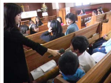
こども達との交流