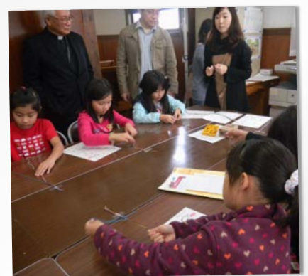
内容③ ミサンガ作り体験